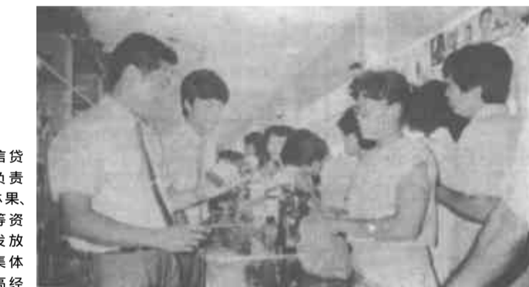
随着商品经济的发展，经济合同纠纷大量增加。那么，发生经济合同纠纷后怎么办？

广饶县委、县政府今年办十件大事之一的好事。广饶县城北环路拓宽工程，于4月份动工，最近圆满竣工，正式通车。（李会宗） 东城农贸市场建成，并于8月22日通过验收。目前，市场日上市摊位达100多个，上市人数2000余人次，日成交额6000余元。（付金生 徐广清） 最近，东营区保险办事处在全市率先开办了“家庭财产两全定额保险”。该险种开办头10天，已有约1500户参加保险，承担风险约750万元。（郝志山）